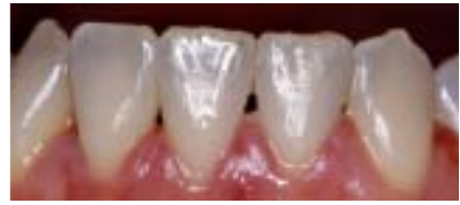
▲ Abb. 8a–c: Aufgrund der Nichtanlage des Zahnes 41 blieben Lücken in der Unterkieferfront, die durch Zahnverbreiterung mit Kompositmasse beseitigt wurden.

die Engstände in beiden Fronten. Nach Angaben der Patientin wurde bei ihr keine Extraktion einer der Frontzähne im Unterkiefer unternommen, was eine Nichtanlage eines Frontzahnes bestätigt (Abb. 3a–e).