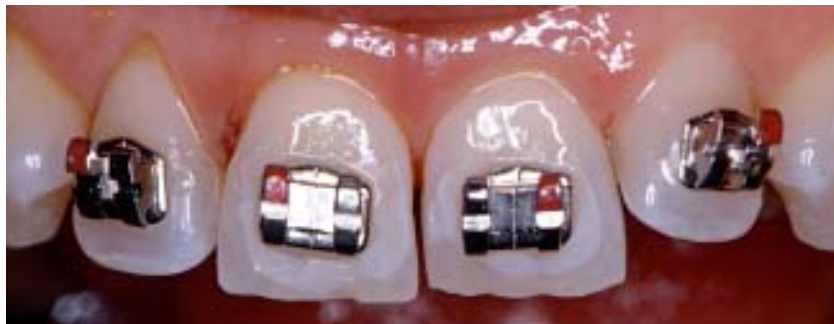
▲ Abb. 7: Eine Schmelzreduktion – Stripping – an der Oberkieferfront wurde durchgeführt.

ration nachwies, nachdem Knochen- transplantationen angewandt wurden.