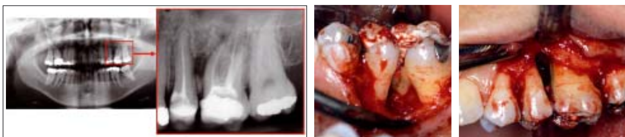
▲ Abb. 4: Die Röntgenaufnahme zeigt Knochendefekt zwischen den Zähnen 25 und 26. ▲ Abb. 5a–b: Operative Darstellung des Knochendefektes am Zahn 26 von bukkal und palatinal.

Die Regeneration des Parodontiums kann durch Knochentransplantate unterstützt werden. Dabei handelt es sich um autogenen Knochen, der sowohl extra- als auch intraoral gewonnen werden kann. Als extraorale Entnahmestelle wird der Beckenkamm bevorzugt. Der entnommene