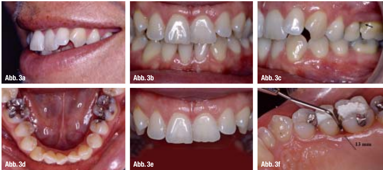
▲ Abb. 3a–f: a: Die Zahnfehlstellungen beeinträchtigen das Erscheinungsbild beim Lächeln. b–c: Situation vor Beginn der PA- und KFO-Behandlung; eine Klasse I-Okklusion an den ersten Molaren, aufgrund der Nichtanlage des Schneidezahnes im Unterkiefer stimmt die Mitte nicht mehr. d–f: Aufsichtaufnahme der beiden Kiefer; Zahnfehlstellungen und Engstände in beiden Fronten, eine Nichtanlage des Zahnes 41, die Zahnform der Frontzähne im Oberkiefer ist gestört. Eine sehr ausgeprägte Sondierungstiefe mesial des Zahnes 26, die Gingiva erscheint in dieser Region entzündet.

webe, speziell des Alveolarknochens und des bindegewebigen Attachments. 24 Die konventionellen Parodontaltherapien wie Scaling und Wurzelglättung haben zum Ziel, das Fortschreiten von parodontalen Attachmentverlusten und Alveolarknochendestruktionen zu stoppen und somit die Zähne und ihre Funktion zu erhalten, aber sie sind nicht in der Lage, vorhandene Defekte durch Gewebeneubildung zu regenerieren. 13, 24 Untersuchungen der parodontalen Wundheilungsmechanismen nach konventionellen Lappenoperationen haben gezeigt, dass die schnelle Proliferation des Saumepithels nach apikal ein New Attachment bzw. eine Regeneration weitgehend verhindern (Abb. 1). Die Regeneration des Parodontiums scheint nur von Zellen des Alveolarknochens und des Desmodonts ausgehen zu können. 6, 21, 30, 36, 47 Diese Erkenntnisse veranlassten Nyman et al. 1982 den von Granulationsgewebe infizierten Zement- und Knochengewebe gerei-